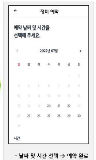
- 날짜 및 시간 선택 → 예약 완료