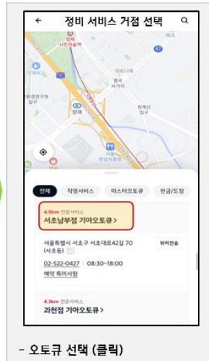
- 오토큐 선택 (클릭)