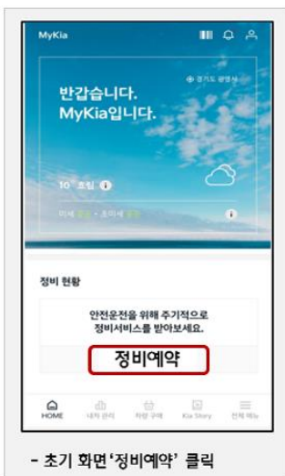
- 초기 화면 '정비예약' 클릭

* 모바일App 이용 시 예약센터 유선 상담전화 연결 지연에 따른 불편없이 간편 리콜예약 가능 * MyKia주요서비스 : △ 정비예약, △ 정비이력관리, △ 신차정보 등