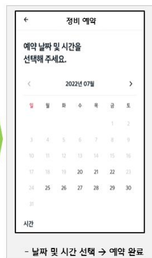
- 날짜 및 시간 선택 → 예약 완료