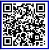
( 안드로이드 )