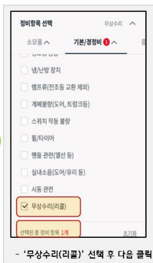
- '무상수리(리콜)' 선택 후 다음 클릭