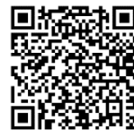
[서비스 네트워크 찾기]

다. 시행 초기 입고량이 많아 조치가 지연될 수 있으니 반드시 예약 후 입고하시길 바랍니다.