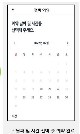
- 날짜 및 시간 선택 → 예약 완료