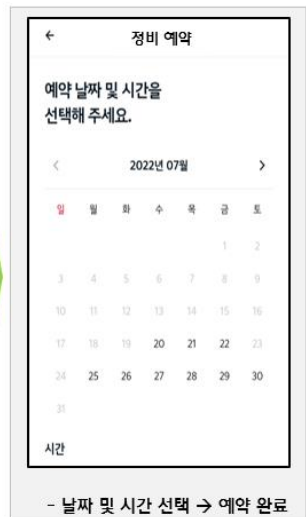
- 날짜 및 시간 선택 → 예약 완료