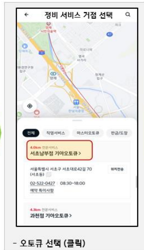
- 오뚜기 선택 (클릭)